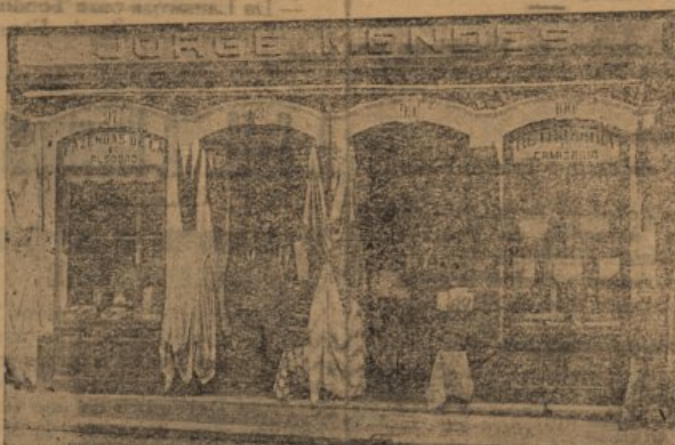
Praca Velha, 97 a 100