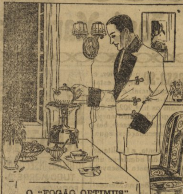
O "FOGÃO OPTIMUS"

a Gas do Petróleo - a mais económica e segura