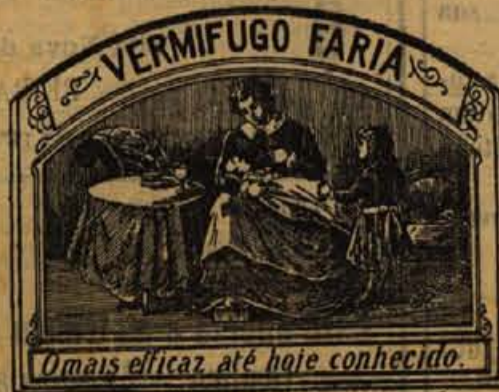
Omnia efficaciter, até hoje conhecido.

O Vermifugo Faria é o melhor remedio e mais eficaz para a expulsão das lombrigas.