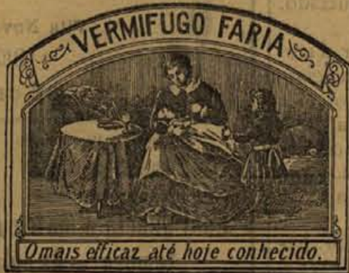
O mais eficaz até hoje conhecido.

O Vermifugo Faria é o melhor remedio e mais eficaz para a expulsão das lombrigas.