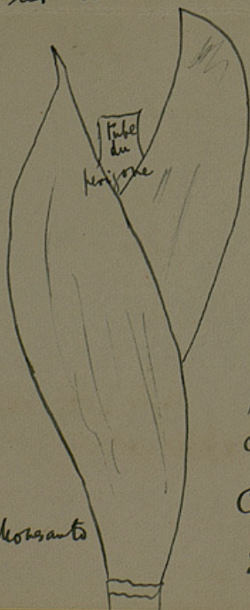
Iris de Serra Monsanto

En étudiant cet Iris dans l'herbier de Kew, j'ai trouvé aussi des exemplaires d'un Iris remarquable, venant de la Serra Monsanto Portugal , montagne que je n'ai pu trouver sur aucune carte. De plus il