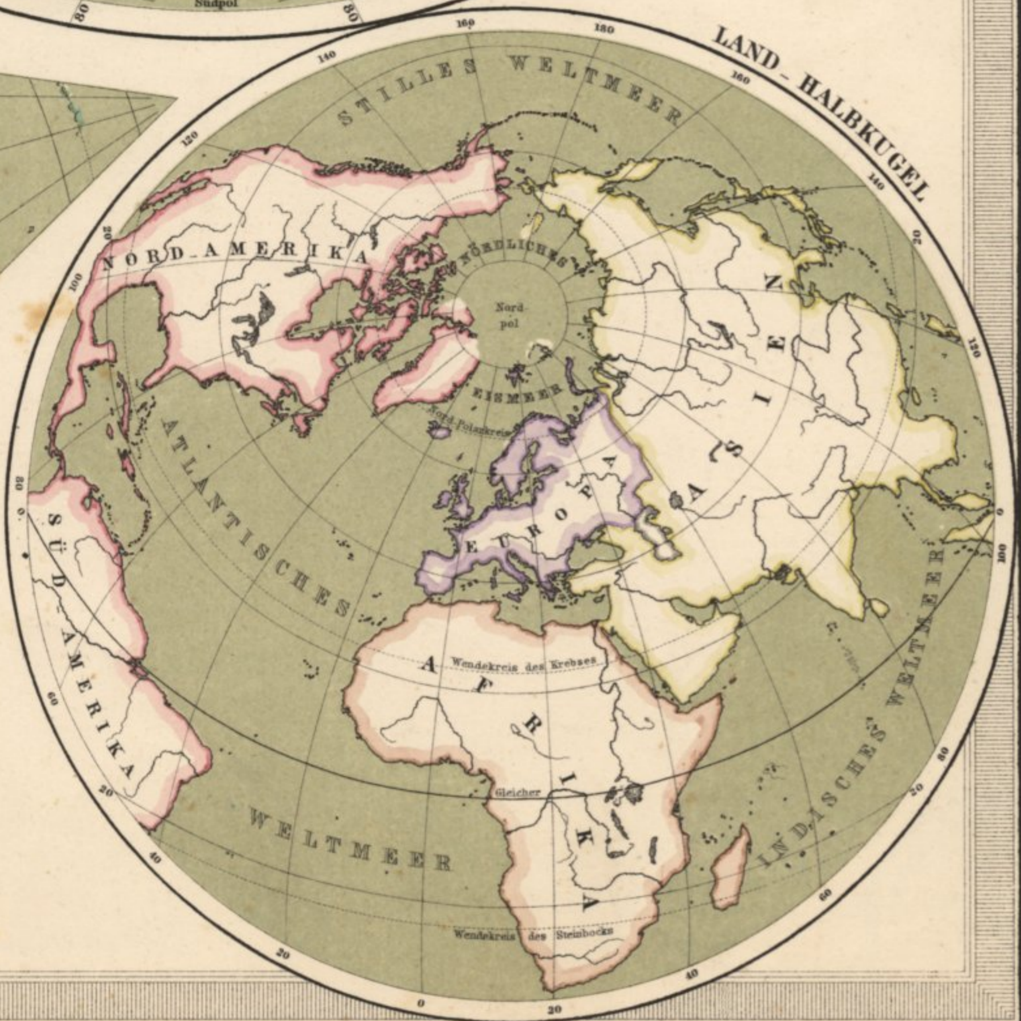
ERDKARTE in Polar Projection nach eigener Entwurfsart