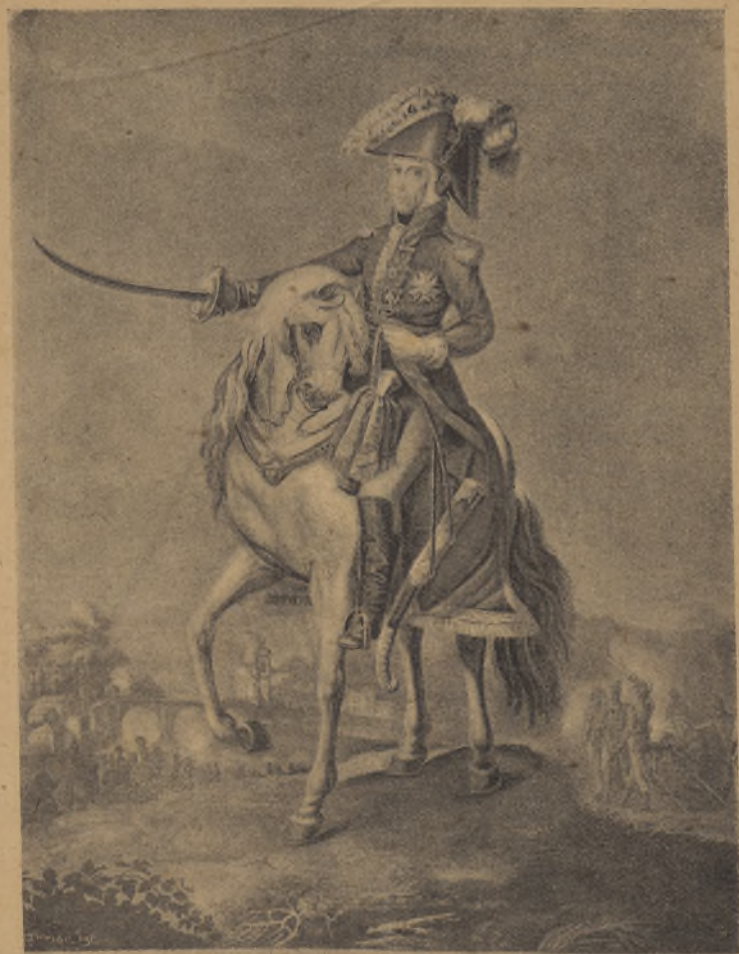
Maréchal Silveira Lorde d' Amarante