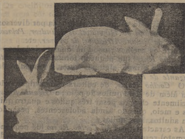
Em cima: o macho; em baixo, a fêmea, ambos com 8 meses e pesando cinco quilos

A sua carne é de primeira qualidade, extremamente fina, e pelo menos igual à das outras raças, estando, entretanto, a qualidade da carne mais ou menos subordinada a dois factores muito importantes, que são o bom alojamento e a boa alimentação.