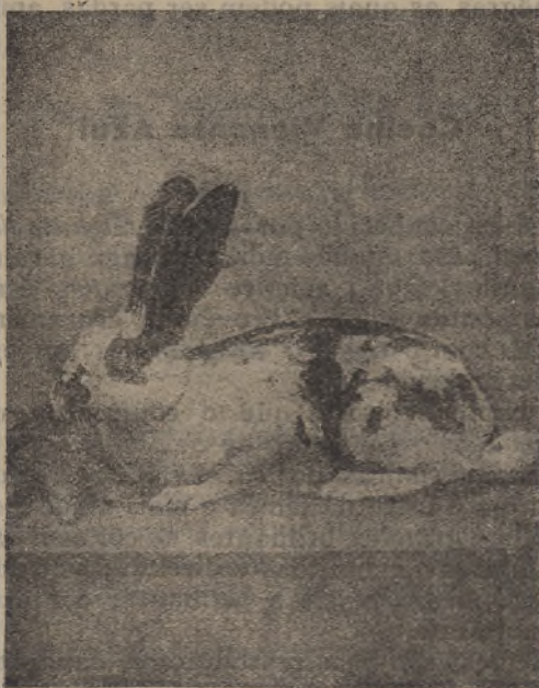
Um bonito exemplar de Coelho Borboleta

O coelho Borboleta deve ser produto dum cruzamento, cujos factores, se bem que não estejam