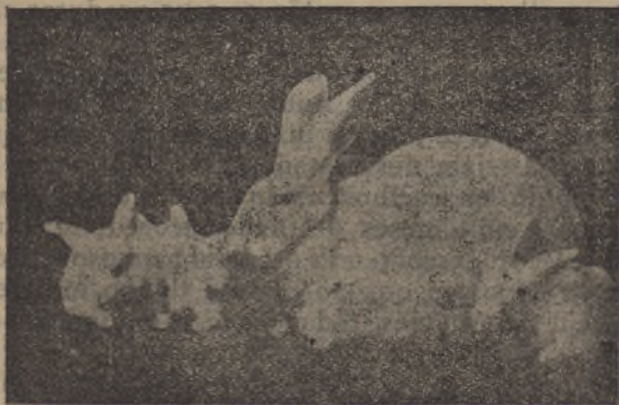
Fêmea «Gigante Branco de Vendaia», com cinco filhos nascidos do primeiro parto

«Dela, essencialmente, depende que os reprodu-