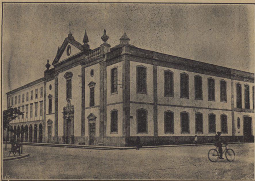
Hospital da Misericórdia de Faro