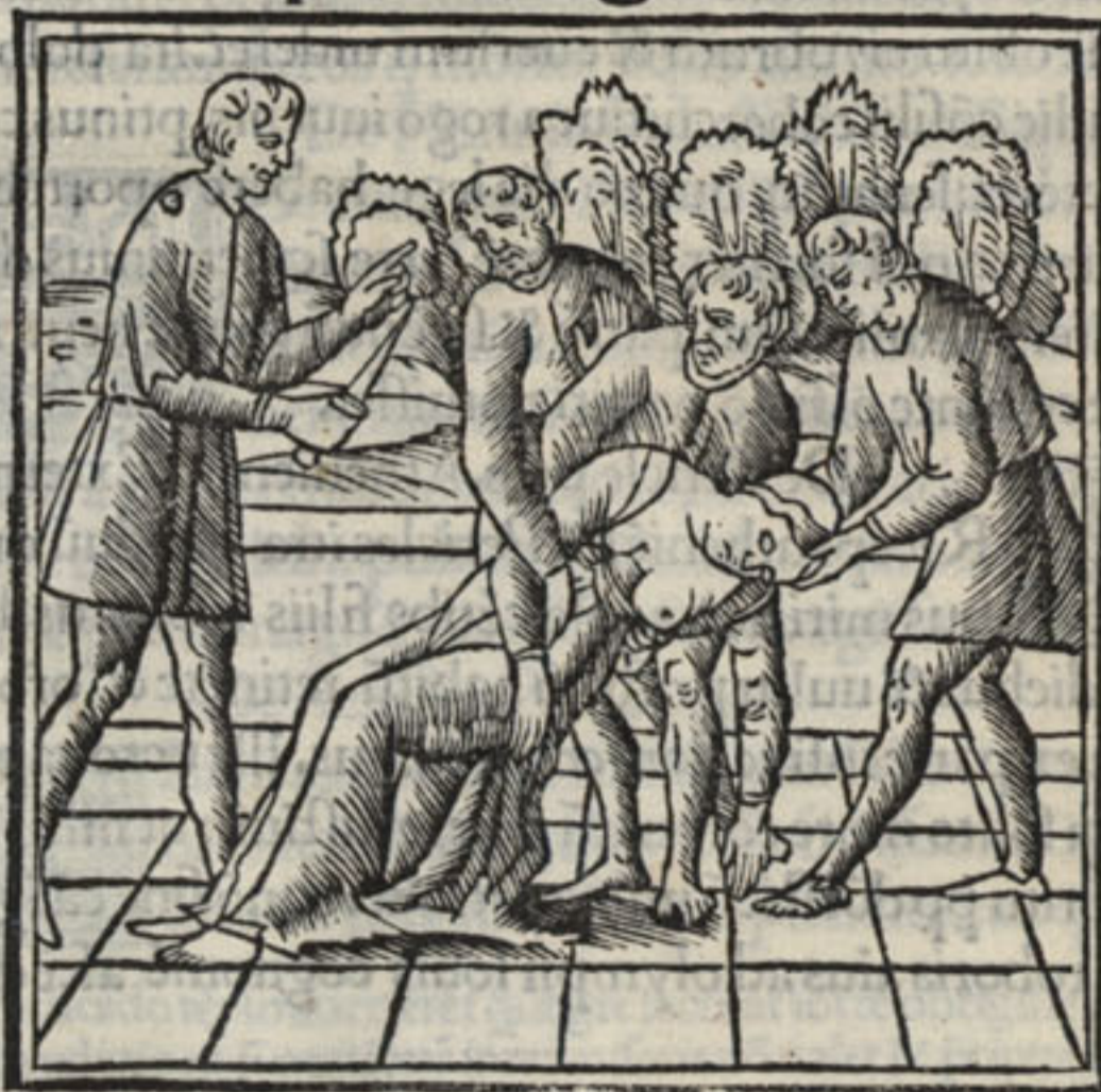
Valerii Maximi Liber. VI. De Pudicitia. Ca. I.