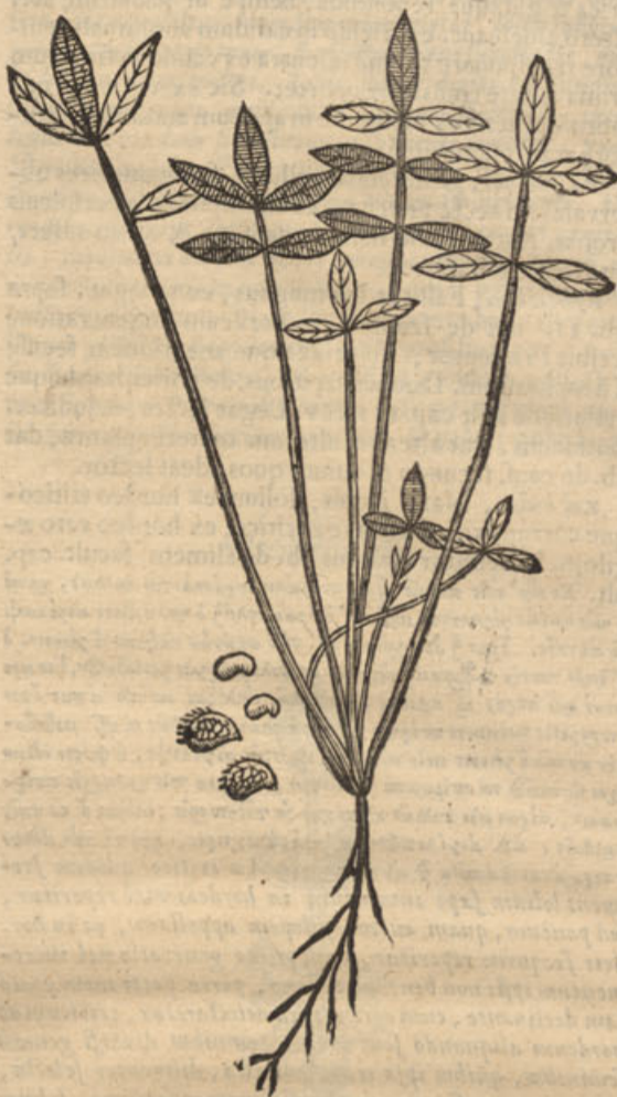
Onobrychis cum flore.