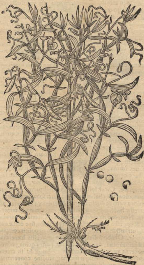
Aracus, aut Cicera Lob.