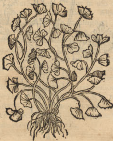
Adiantum, capillus veneris verus.

pumulam, aliqui philiicam, folia habet filici similia, alterum adiantum, id est, tertium foliis est lenticula similibus ad-versis inter se, in virgulis. Duo posteriora adianti genera unum sunt. Dioscorides Trichomanes vocat, diciturque foliorum situ filici esse similia: folia autem ipsa facie φανερὰ esse. Adiantum album non descripsit Dioscorides; nigri has tradidit notas, lib. IV. cap. cxxxv. ἀδιάντων, οἱ δὲ πολυτριχόν, φυλλὰ ὅμοια ἔχει κέρας ἑνὸς ἑτέρου ὄμοια, ἰσὼ δὲ αὐτῶν (quæ sequuntur in antiquissimo non reperiuntur codice, inclusa non habentur apud Oribasium)