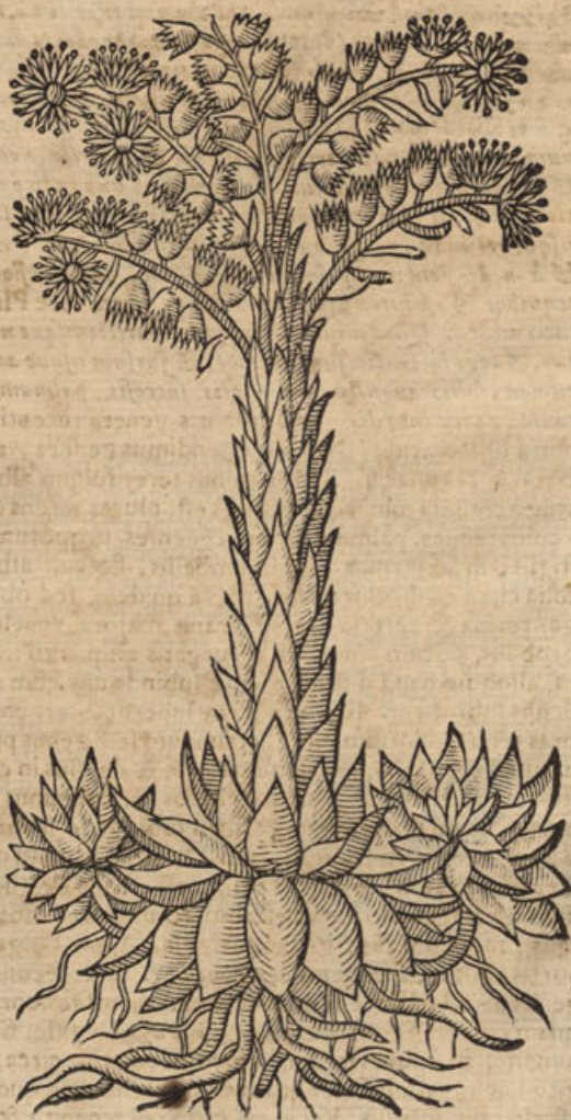
Semper vivum majus.