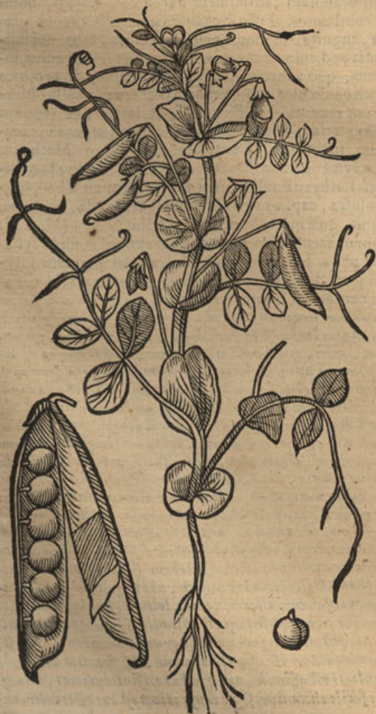
Faba silvestris Græcorum Lob.