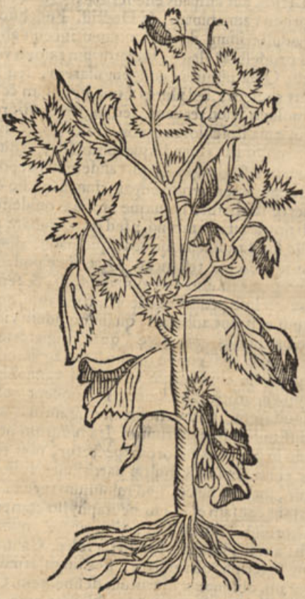
Xanthion personata minor.

antihethesion, alii chascanon, alii chervadolethron; quasi stru- marum perniciem (Unde quibusdam, quod adversus tu- mores strumæ valeat strumaria dicitur) aliqui & apa- rinem vocant. (Apud Ætium φιλῆρηρον legitur, quod nomen aparinem habere, supra diximus.) Nascitur læso & pingui solo, itemque in paludibus ex siccatis, caule cu- curbitæ, pingui, anguloso, & prodeuntibus ex eo alis complu- ribus. Folia verò habet atriplicis, incisuras habentia, nar- sturcium odore imitantia: fructum teretem, grandis olivæ instar, & platani pilularum instar spinosum. Qui quidem contactu vestibus adherescit; si collectus, antequam perfe- ctè siccescat, deinde rufus & siccis vase reconditus, ruffos facit capillos: siquidem, cum usus exigit, ejus sectarii semis- sem aqua tepida diluas, moxque eo caput nistro ante perfrin- ctum illinas. Sunt qui in vino tundant, atque asservant.