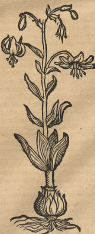
Lilium floribus reflexis.

quantur bulbifera vocat I. Liliū bulbiferum latifolium majus: Lobelius liliū cruentum, bulbos majusculos squamatim compactos gerens, summo alis diviso caule, vocant. II. Liliū bulbiferum angustifolium. III. Liliū bulbiferum minus, sive liliū purpureum tertium Dodonei. IV. Liliū bulbiferum in carnem à Lobelio & Clusio depictum. Dantur & alia liliū genera, quæ pro syl-