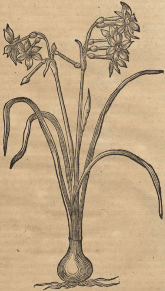
Narcissus junci foliis major.