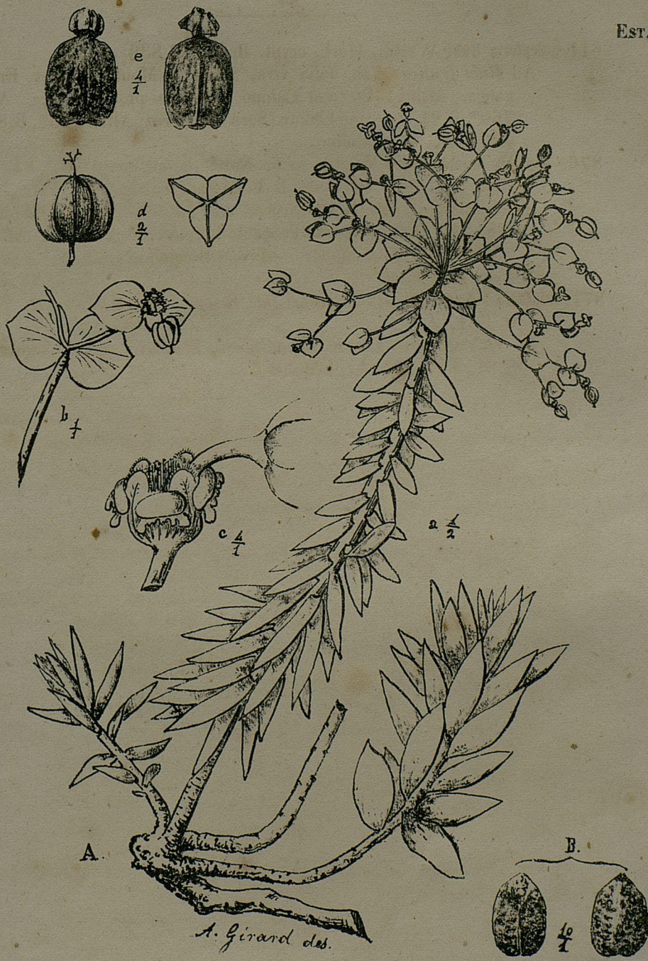
A. (a-e) EUPHORBIA BROTERI Dav. — B. E. FALCATA W. & Lusitanica Dav.