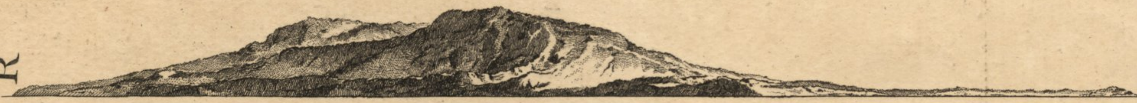
Vue du C.de la Roque restant à l'Est quart de Sud Est à Cinq Lieues de Distance. Etant au Point C.