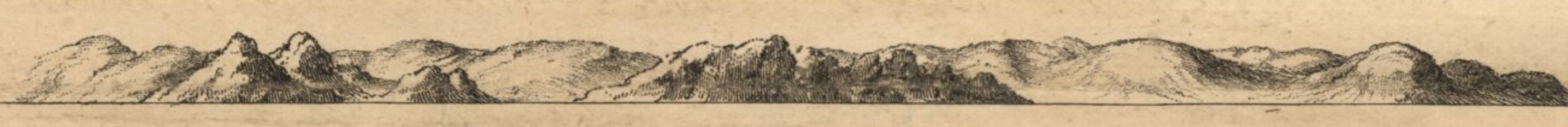
Vue des Isles de Bayona restant au Sud Est quart de Sud à Deux Lieues de Distance. Etant au Point F.