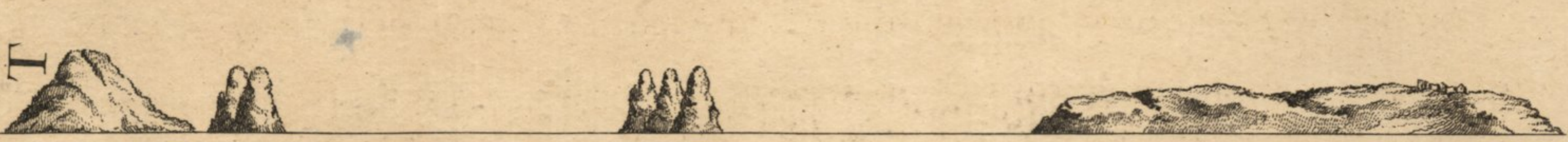
Vue des Barlingues la plus Nord restant au N.E. 4 N. à Cinq Lieues de Distance. Etant au Point D.