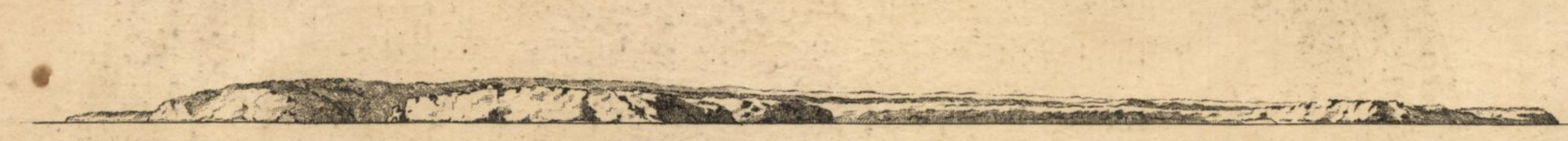
Vue du Cap de S t Vincent restant à l'Est quart de Nord Est à Cinq Lieues de Distance. Etant au Point A.