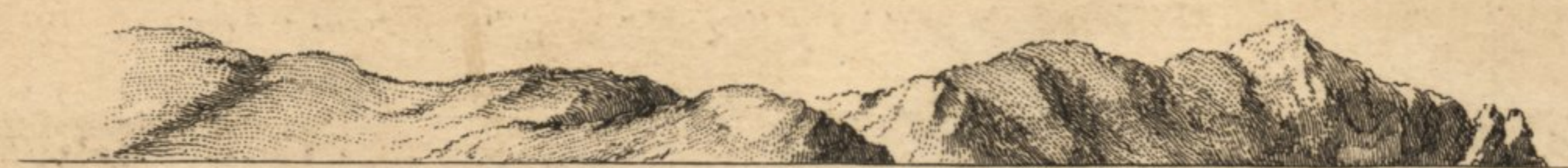
Vue du Cap de Finisterre restant à 2 Lieues et demie au S 4 S. Ouest. Etant au Point G.