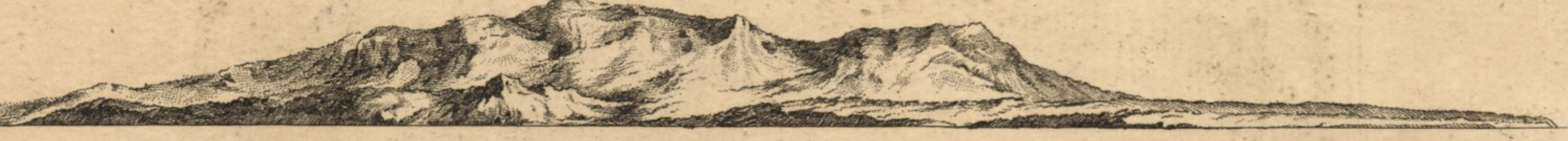
Vue du C.de la Roque restant au Nord-Est quart d'Est à Huit Lieues de Distance. Etant au Point B.