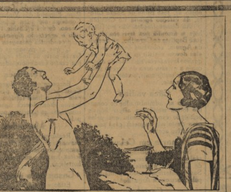
As expressões de Bêbé