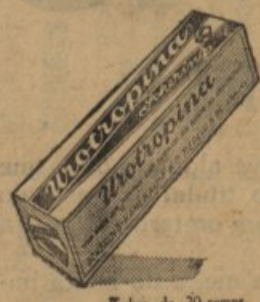
Valor de 30 contos.

Fazer desaparecer os microbios nocivos do organismo é uma tarefa mais difficil do que limpar um jardim de hervas nocivas. Para isso será indispensavel servir-se da Urotropina, considerada pelas eminencias medicas como da mais alta eficacia. Empregue V. E. para prevenir e curar doencas infecciosas (gripe, angina, etc.) especialmente das vias urinaarias e biliarias, sempre os