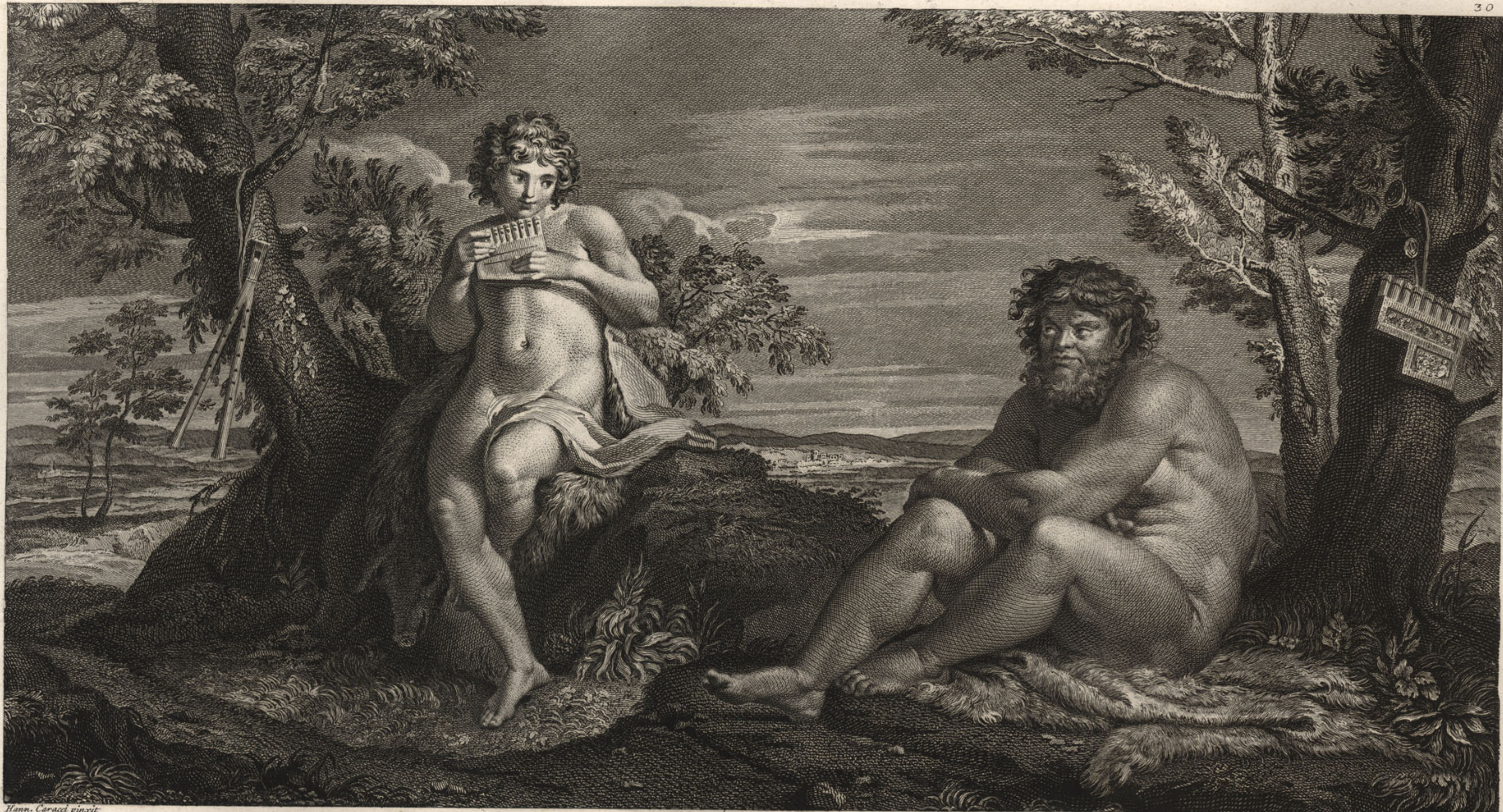
Apollo et Silenus Romae ex Tabula in Aedibus Lancellotti