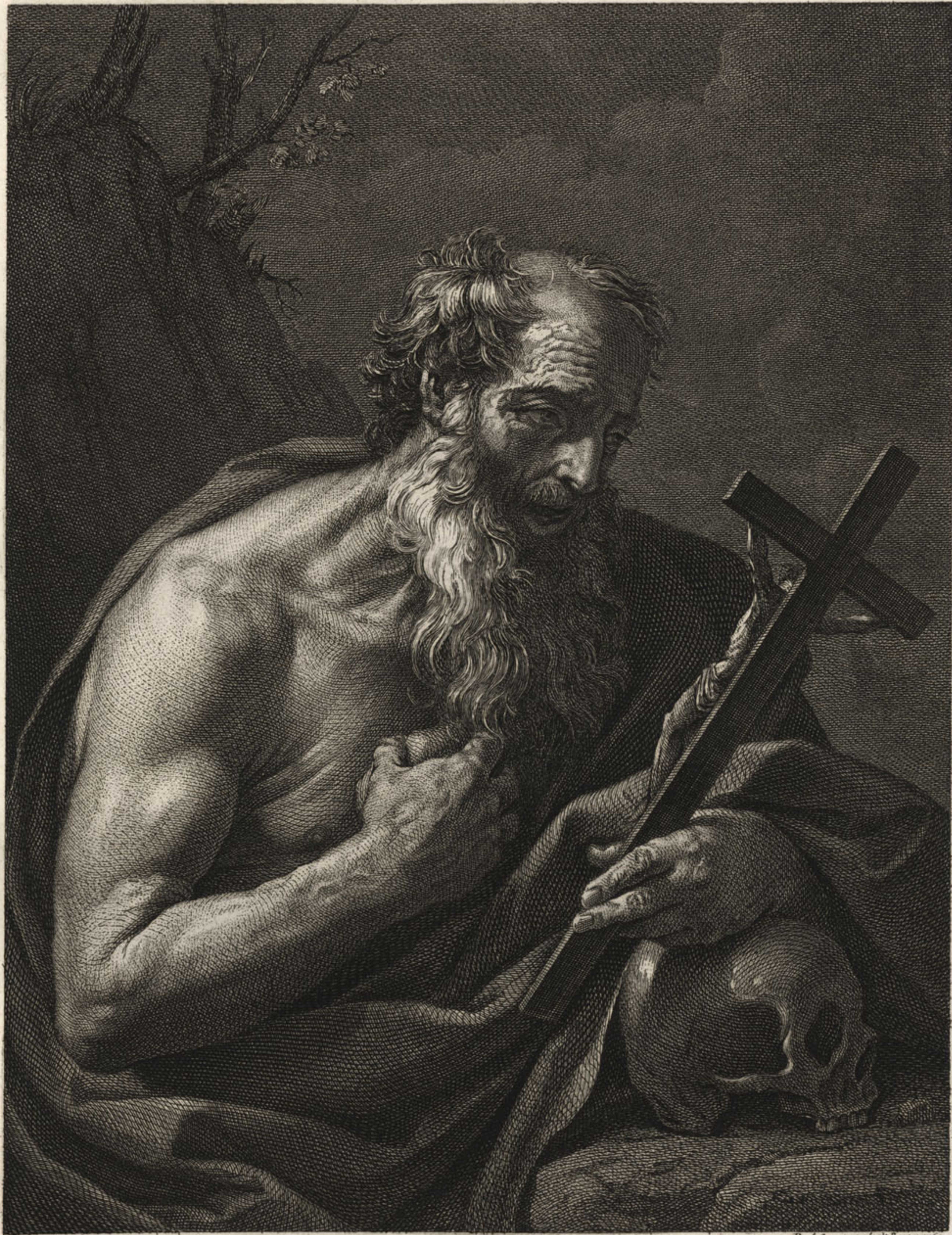
S. HIERONYMUS Romæ apud Gavinum Hamilton