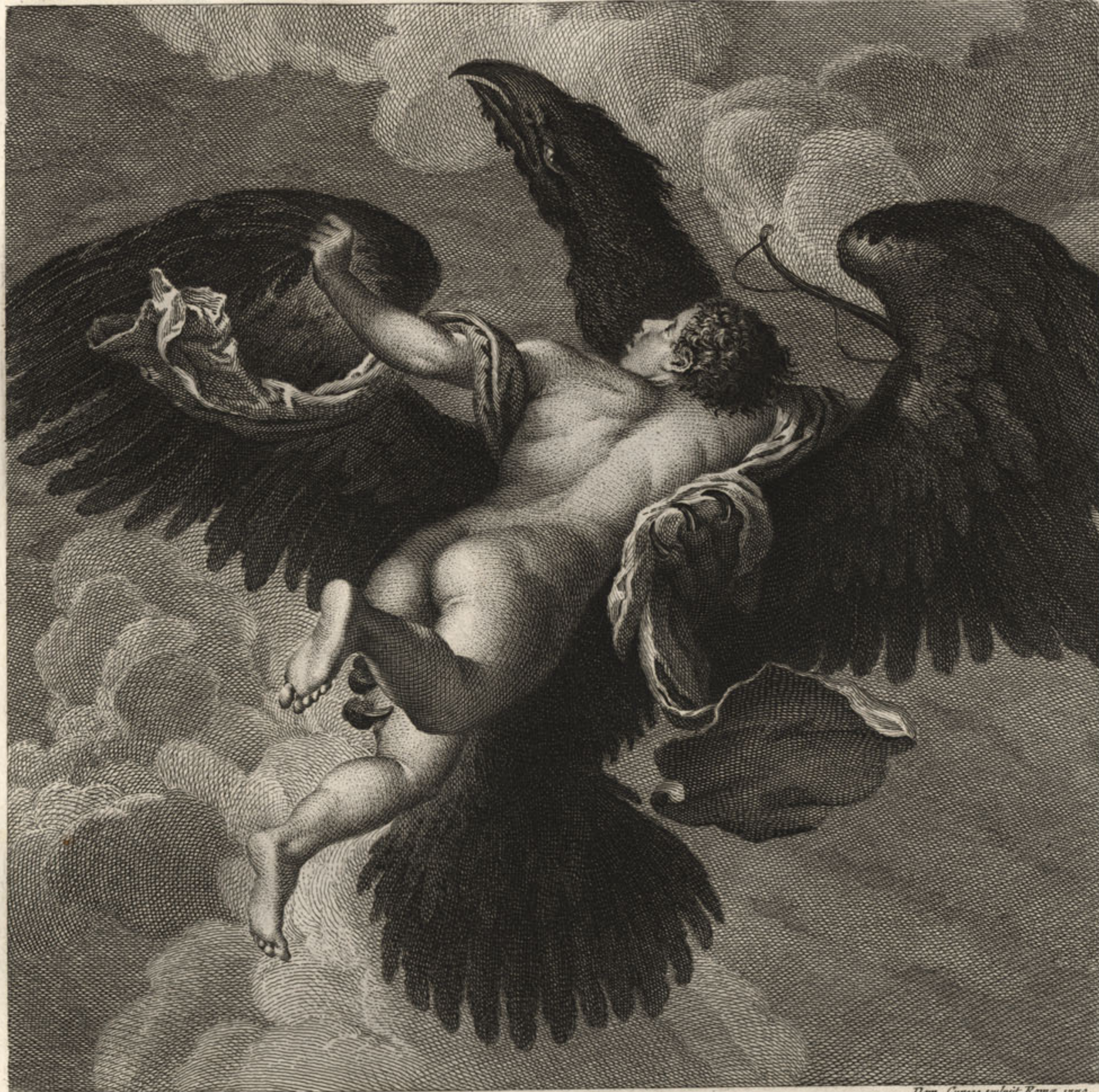
Ganymedes ab Iove raptus

Rome ex Tabula in Pinacotheca Com. Stabulis Colonnae