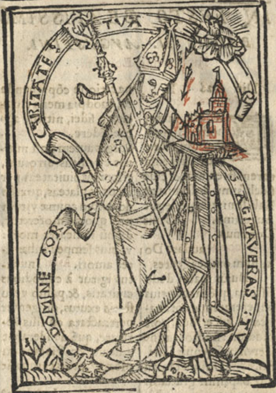
S. AVGVSTINVS CAN. REG.