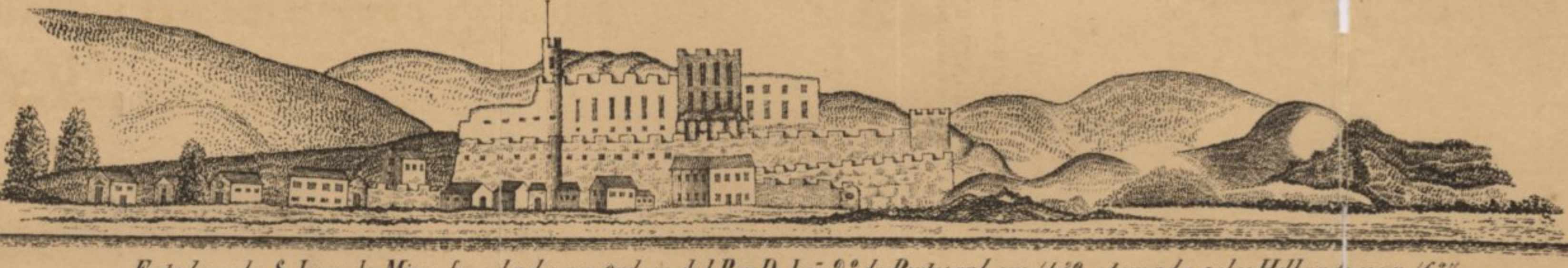
Portaleira de S. Jorge da Mina, fundada por ordem do Rey D. João II de Portugal, em 1482, e tomada pelos Holandeses em 1681.

ILHA DE FERNÃO DO PÓO cedida a Hespanha pela Coroa Portuguesa em 1588